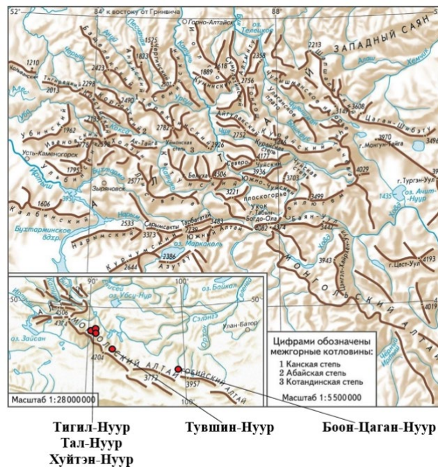
Fig.1. Orography scheme of the Altai mountain system according to Bulanov (2005) and the location of lakes in the Mongolian Altai